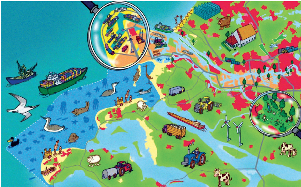
Cartoon Maasvlakte 2 en Voordelta

De Voordelta is een uniek gebied. In Nederland, maar ook binnen Europa. Ondiepe zee, afwisseling van zoet en zout, diep en ondiep water zorgen voor bijzondere leefgebieden. Veel plant- en diersoorten in het gebied hebben bescherming nodig om voort te kunnen blijven bestaan.