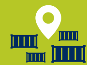
CALL SIZES VERHOOGD NAAR GEMIDDELD 8.300 TEU