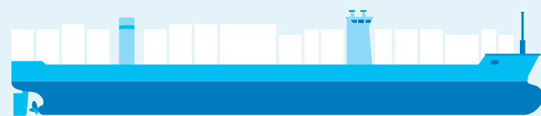
24.000 TEU CONTAINERSCHIP 16M DIEPGANG / AFMETING: 400M LENGTE x 61M BREEDE

Om de wachttijden voor containerbinnenvaartschepen bij de Rotterdamse deepsea terminals te beperken zijn inmiddels diverse initiatieven genomen. Eén van die initiatieven is het bundelen van lading in West Brabant. De samenwerking tussen Oosterhout Container Terminal, BTT Multimodal Container Solutions in Tilburg en Bergen op Zoom, Combined Cargo Terminals, Moerdijk Container Terminals en de deepsea terminals in de Rotterdamse haven op de 'West-Brabant Corridor' is het eerste concrete initiatief waar positieve resultaten benoemd kunnen worden. Door het bundelen van lading op deze corridor is een betere bezettingsgraad van de binnenvaartschepen gerealiseerd en daarmee zijn de wachttijden bij de terminals verlaagd.