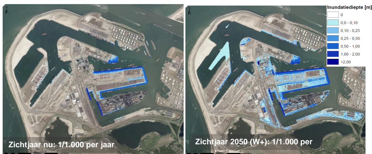
Figuur 2. Waterdieptes Maasvlakte bij een stormscenario op de Noordzee met kans van 1/1.000 per jaar - links voor het zichtjaar nu en rechts voor het zichtjaar 2050 bij het W+ klimaatscenario (zichtjaar 2100 bij het G scenario).

Een zeespiegelstijging van 35 cm vergroot de kans dat een overstroming leidt tot water in een significant deel van het gebied naar een herhalingstijd van eens in de 1.000 – 3.000 jaar. Bij een zeespiegelstijging van 85 cm nemen zowel het areaal als de waterdieptes toe in geval van een overstroming. Het beeld van een overstroming van 1/10.000 jaar in de huidige situatie is ongeveer vergelijkbaar met een overstroming van 1/3.000 jaar in 2050 en van 1/1.000 jaar in 2100 op basis van het W+ klimaatscenario. De overstromingskans neemt dus ongeveer met een factor 3 toe in 2050 en weer met een factor 3 in 2100. Figuur 2 presenteert de waterdiepte kaarten voor een overstroming met een kans van voorkomen van 1/1.000 per jaar nu en met een zeespiegelstijging van 35cm.