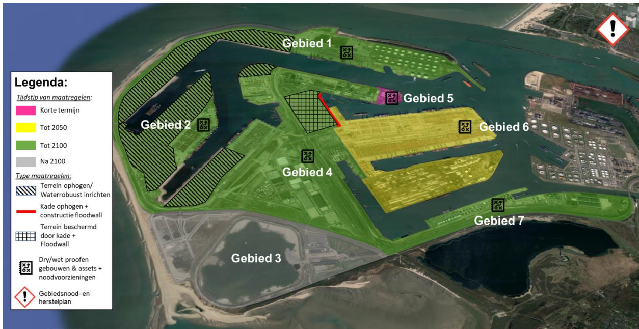
Figuur 3. Veelbelovende adaptatiestrategie voor de Maasvlakte.

vaststaand eindbeeld. Het is bedoeld om inzicht te geven in de knikpunten wanneer besluiten over overstromingsrisicobeheersing wenselijk zijn en kansrijke maatregelen vanuit het perspectief van de betrokken partijen en economisch perspectief. Figuur 3 visualiseert de veelbelovende adaptatiestrategie die aanbevolen wordt voor de Maasvlakte. Zowel de timing als de keuze voor een maatregel is uiteindelijk een bedrijfseigen afweging. In de praktijk kunnen de timing en de maatregelen dus verschillen van de veelbelovende adaptatiestrategie.