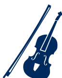
Rotterdams Philharmonisch Orkest